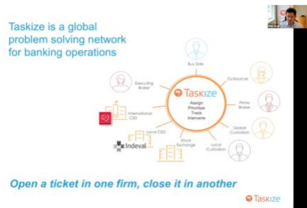
Cómo los CSDs pueden mejorar su eficiencia operativa - Taskize. Octubre 27,2021