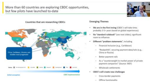
Monedas digitales – EY Septiembre 30,2021