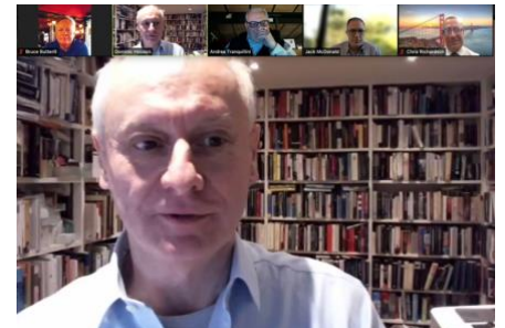
Qué pueden hacer los CSDs sobre la tokenización del mercado de valores - Future of Finance Noviembre 25,2021

ACSDA desea expresar nuestra más sincera gratitud a nuestros socios de apoyo desde 2021. Sin su contribución de expertos, sería imposible para nosotros ofrecer nuestro programa integral de seminarios web.