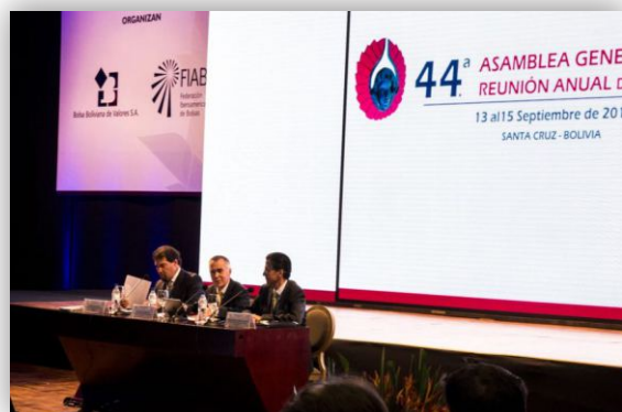
Apertura de la 44° Asamblea General