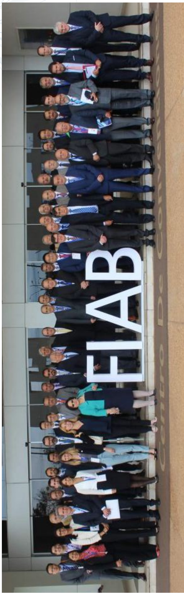
Foto grupal de los Delegados a la 45° Asamblea General de la FIAB - Luque, Paraguay - 20 y 21 de septiembre de 2018